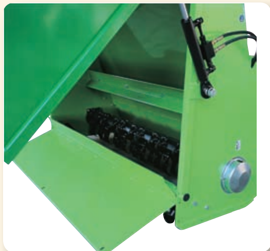
Apertura porta interna per facile ispezione e manutenzione Inner door for quick inspection and maintenance Porte intérieure pour une inspection et maintenance rapides Innen-Klappe für Kontrollen und Pflege

Der PANTHER mit hydraulischer Bodenentleerung wird zum Mähen und VERTIKUTIEREN mit gleichzeitiger Aufnahme in einen Sammelbehälter eingesetzt. Diese Maschine bietet ein exzellentes Feinschnitt-Ergebnis, gleichzeitiges Vertikutieren, sowie perfekte Aufnahme in einem Arbeitsgang und damit Reinigung der bearbeiteten Flächen. Der Anbau erfolgt an mittlere bis schwere Kommunaltraktoren in der Heck-3-Pkt. Die Maschine ist ideal zum Einsatz auf kommunalen Flächen und Sportplätzen geeignet.