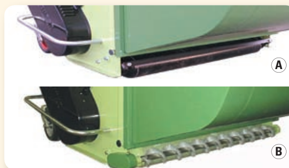
Pulitura rullo con barra raschiatutto (A) o con spazzola per superfici sportive (B) Roller cleaning with scraping metal bar (A) or with brush for sport courses (B). Nettoyage du rouleau avec racleur (A) ou brosse pour terrains de sport (B). Reinigung der Heck-Stützwalze über Stahl-Abstreifer (A) oder mit Bürste für Sportplatzinsatz (B).